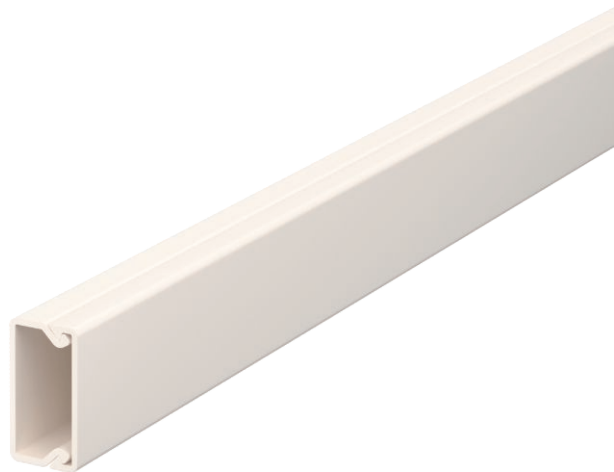
Kanaloberteil und -unterteil mit Bodenlochung.