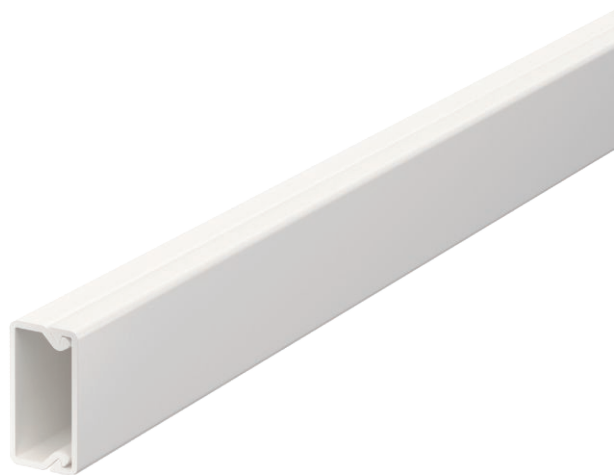
Kanaloberteil und -unterteil mit Bodenlochung.