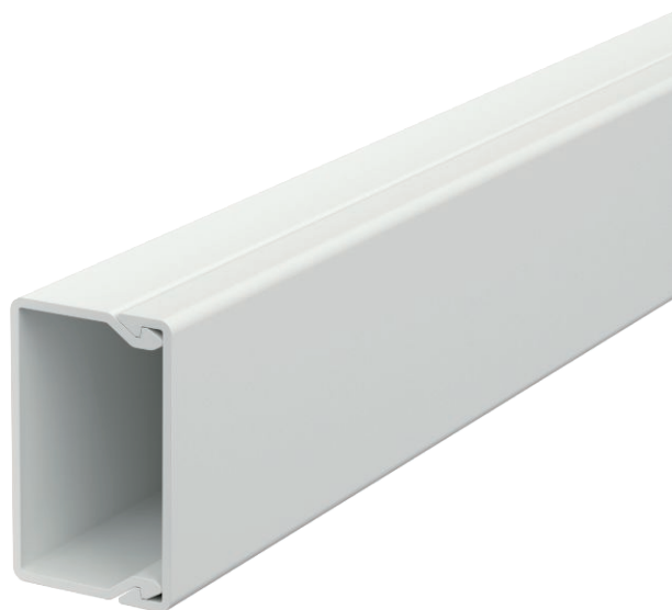
Kanaloberteil und -unterteil mit Bodenlochung.